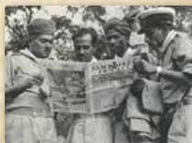
Reading of the gazette

Le jamboree mondial de 1947, connu sous le nom de jamboree de la paix, est un jamboree scout qui s'est tenu du 9 au 20 août 1947 à Moisson (Yvelines, France) et qui a rassemblé des dizaines de milliers de scouts venus de tous les pays de la planète, deux années seulement après la fin de la Seconde Guerre Mondiale.