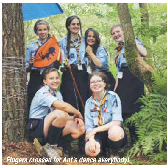
Fingers crossed for Ant's dance everybody!

Several months before the Eurojam, we first heard about activities called „Laborate”. So, when we found out what they were all about, we decided to prepare something unique. Well, easier said than done! We had a lot of ideas. „How to make traditional polish embroidery” was one of them. Then we picked something more dynamic and lively – dance. This particular dance of our choice is an important part of Polish culture. The Polonez – we dance it during most official events.