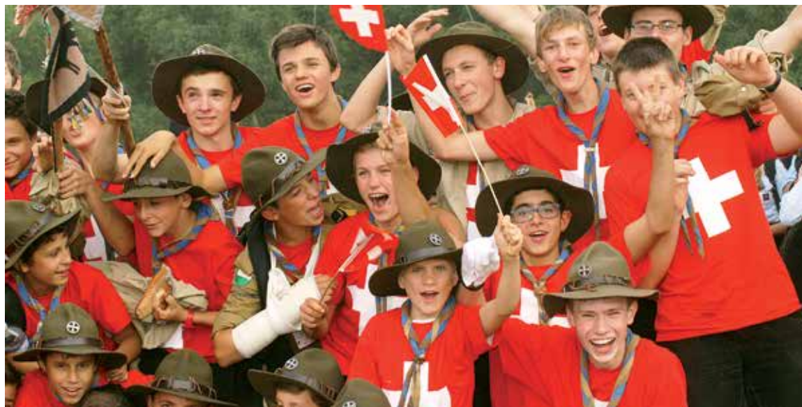
Swiss association after the Opening Ceremony

By Aleksandra Gbyl, Alicja Kędzior, Olga Piotrowska 2nd Krakow, Ant patrol