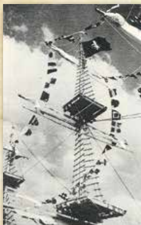
The «Pourquoi pas »