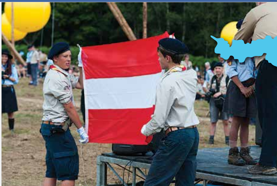
The delegation from Austria on Eurojam Opening Ceremony

After the end of the Habsburg dynasty in the 13th century, the biggest role in