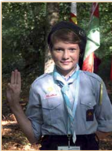
Brave Belarussian guides have to tear throw bushes every day of the Eurojam

our meetings outside either in a forest or by a lake. We learn to use the Morse alphabet, patrol signs, knots, and many more scout techniques. We also learn to pray in different languages, such as Polish, Latin and Russian.