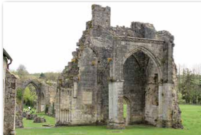
Vestige de l'abbaye de Saint Évroult

It has been 939 years ago was born a small Orderic at Atcham in Shropshire, England. It seems that his father was a native of Orléans. It had settled across the sea after the conquest of Duke William and was profession Clerc. His mother was English. This little boy was to become one of the most important historians of the middle ages. When he was 10 years old, his father confided to the Benedictine monks of the Abbey of St. Evroult, in Normandy. Thus, he became an Oblate. It is at age 15 that he took his monastic vows (at the same age as Saint Thérèse of