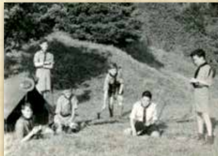
British troop of Hasting